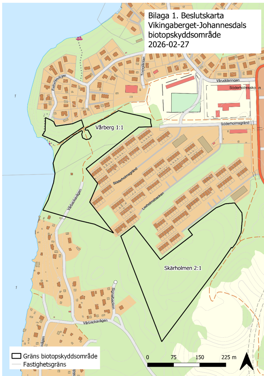
Figur 3. Översikt över föreslaget biotopskyddsområde i Vikingaberget-Johannesdal samt angränsade naturområden.