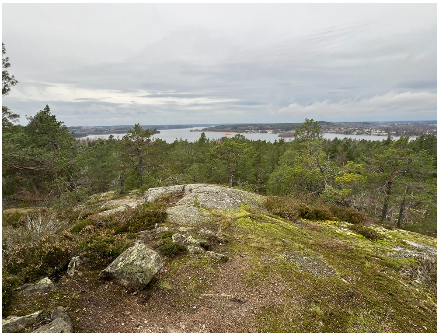
Figur 2. Från Vikingaberget har man en fin utsikt över Vårbyfjärden.

utsiktspunkten. Vikingaberget är del av landskapsparken vid Vårbergstoppen. Johannesdal ligger i ett dalstråk som mynnar ut mellan de branta höjderna vid Johannesdalsbadet. Området genomkorsas av belysta gångstigar och kan nås från söder via Vårbackavägen och från öster från Söderholmsskolan. Det föreslagna biotopskyddsområdet utgör en viktig målpunkt för närboende och elever från skolan.